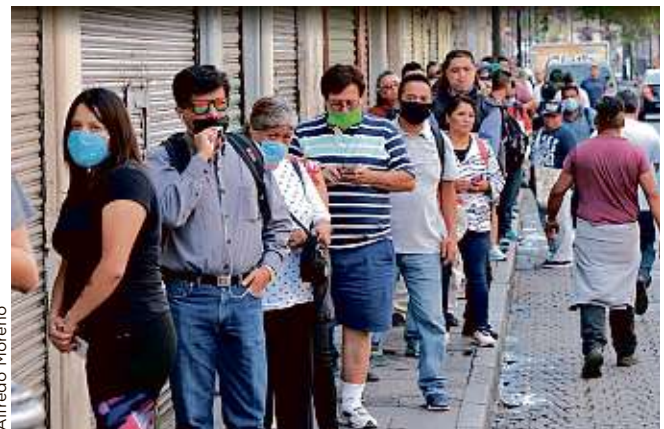
■ Pese a que la Fase 3 por la pandemia de coronavirus se decretó ayer por la mañana, las calles de la ciudad y el transporte registraron movilidad como de un día casi normal.