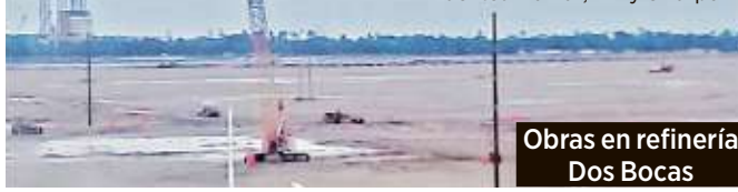
Obras en refinería Dos Bocas

DESPLOME DE LA DEMANDA EN MÉXICO Actualmente estimada en 50% Pudiera llegar a caer 80% en los siguientes meses