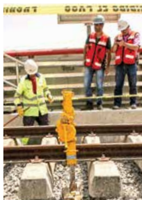
EL DATO

PRIMERA En 2014, el Colegio de Ingenieros no halló fallas en L12 En un informe entregado a la Comisión Investigadora de la Línea 12 de la ALDF, el CIM descartó problemas en el proyecto de ingeniería civil, opinión que cambió la semana pasada. / 16