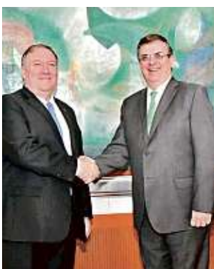
Pompeo y Ebrard ayer, en la sede de la Cancillería.

En el diálogo, que duró aproximadamente una hora, se planteó además conformar un grupo binacional para recuperar los bienes y activos vinculados con Joaquín "El Chapo" Guzmán.