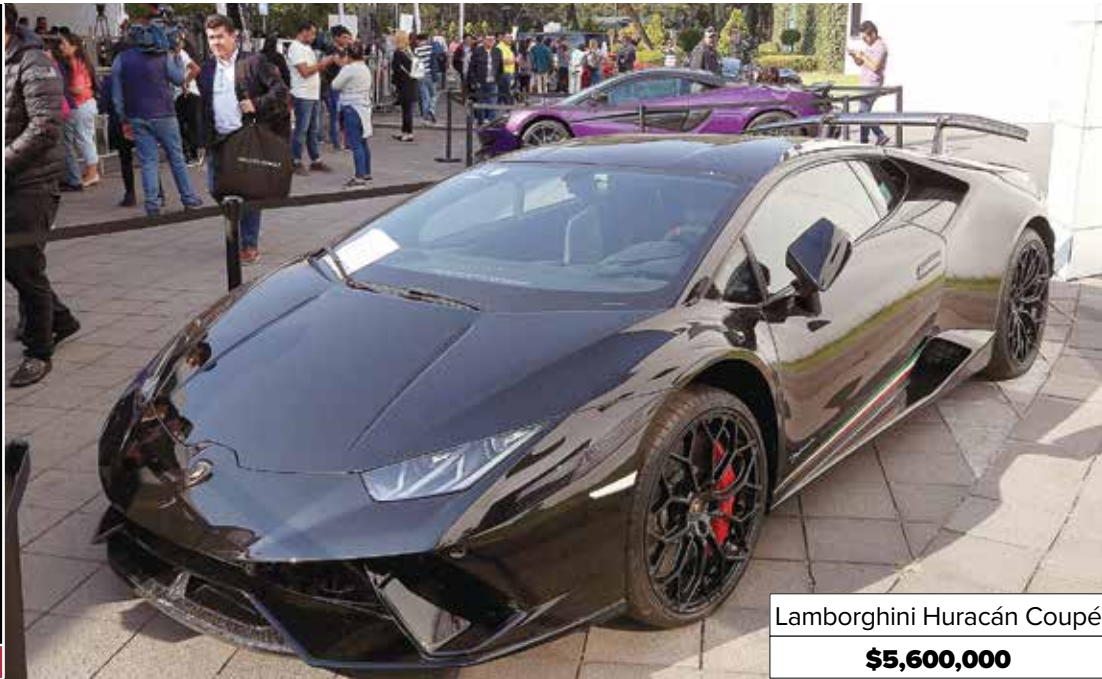
Lamborghini Huracán Coupé $5,600,000