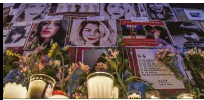
Mujeres colocaron veladoras, flores y fotos en el Ángel de la Independencia para recordar a las víctimas de la violencia de género.