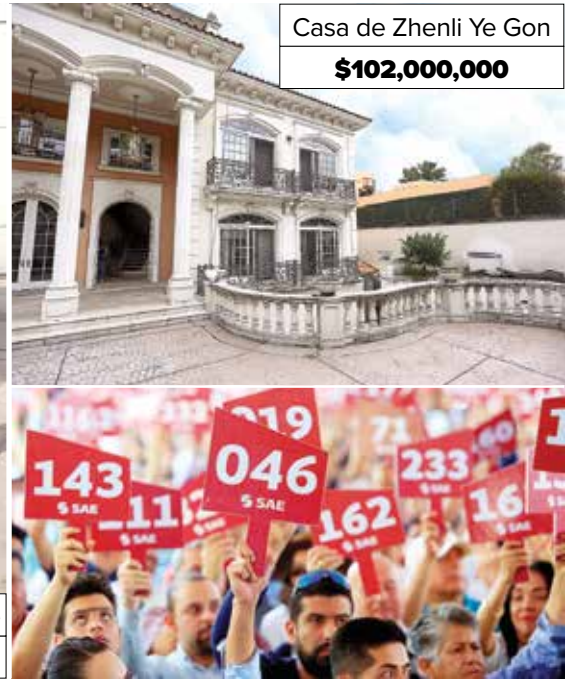
Casa de Zhenli Ye Gon $102,000,000