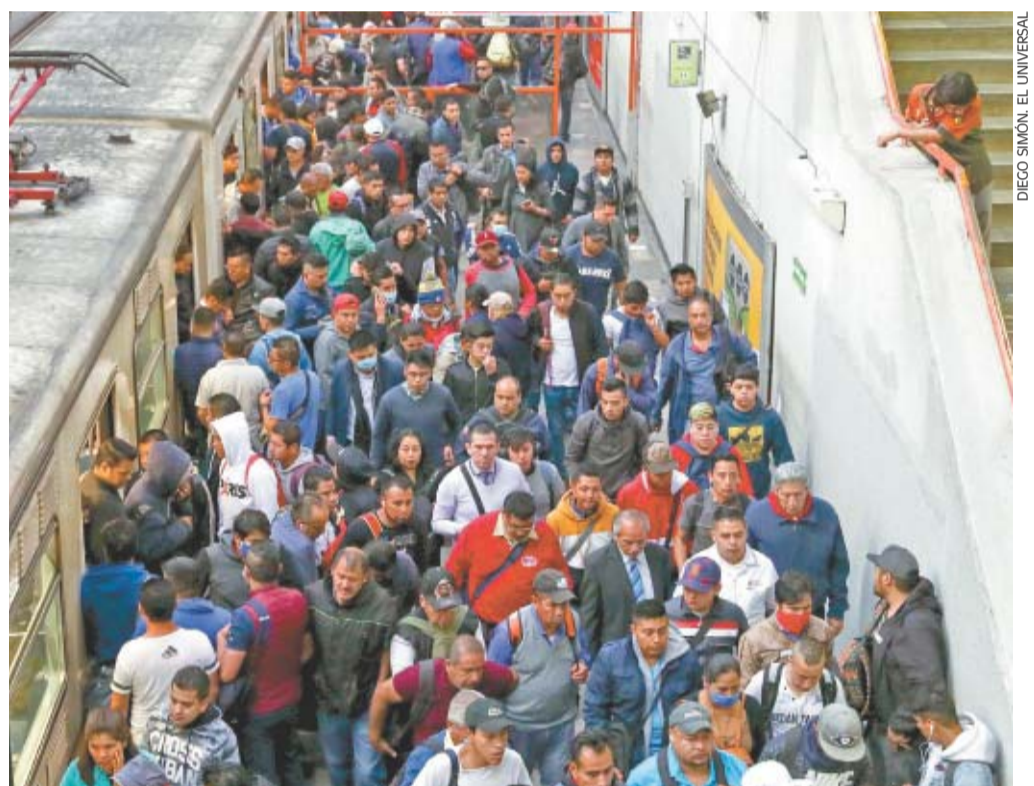
Sin embargo, hay lugares como el Metro Pantitlán en donde las aglomeraciones no bajan. En horas pico es imposible que la gente mantenga la sana distancia en vagones y andenes.

TERESA MORENO —nacion@eluniversal.com.mx