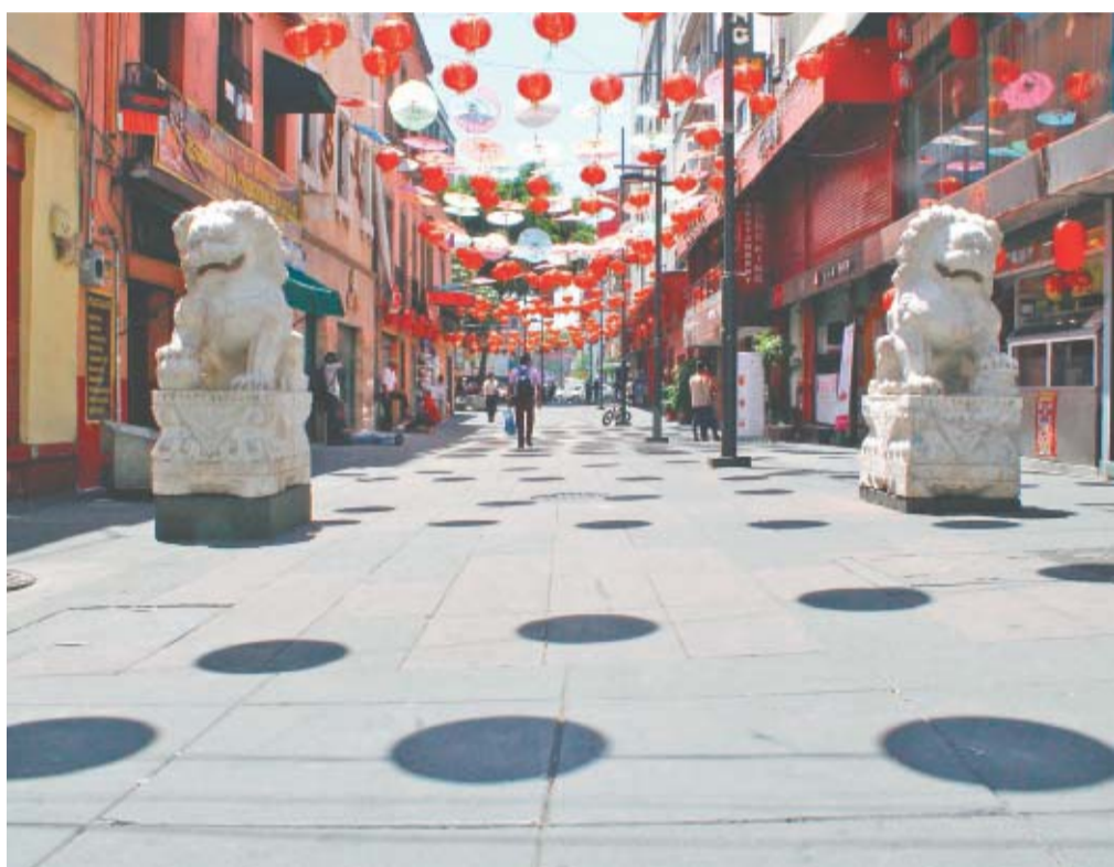
La CDMX empieza a lucir vacía ante la indicación de permanecer en casa para contener al coronavirus. En el Barrio Chino, que suele ser muy concurrido, ayer se observó poca gente.

● Funcionarios mayores de 60 y embarazadas trabajarán desde casa