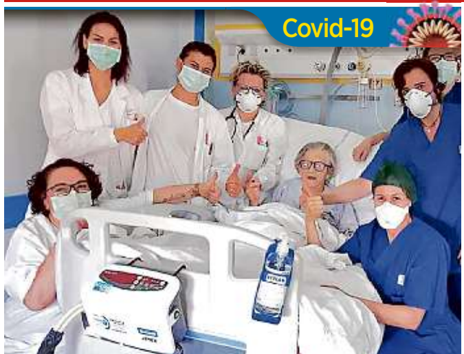
Tomada de Facebook: Papa Francisco

Recibe REFORMA en tu hogar conoce nuestros planes en reforma.com/suscribete o llámanos al 55-5628-7575