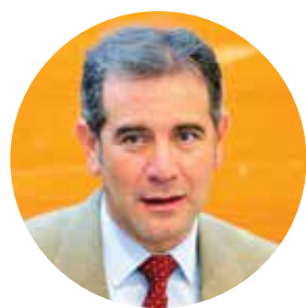
Lorenzo Córdova, presidente del INE.