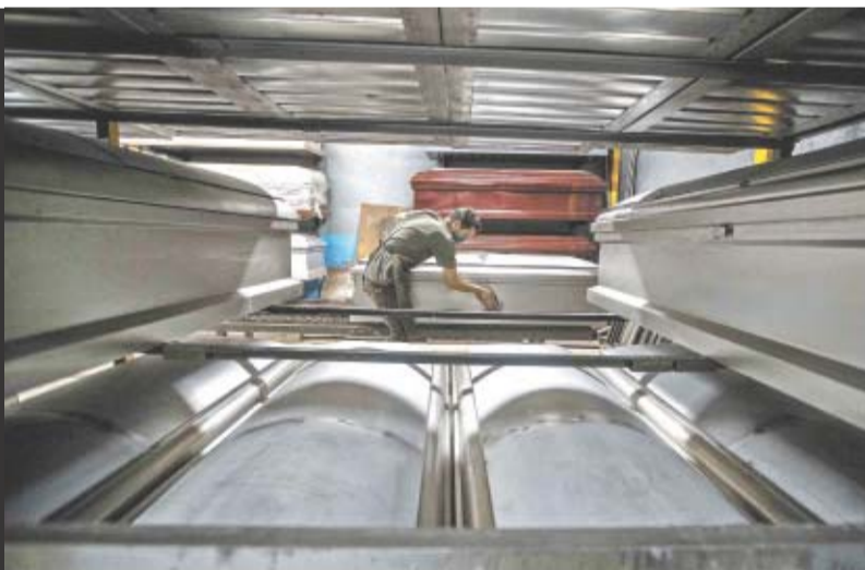
GERMÁN ESPINOSA. EL UNIVERSAL

● Servicios funerarios se incrementan 400%. A6