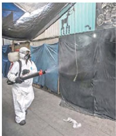
GERMÁN ESPINOSA. EL UNIVERSAL

En Edomex, las llamadas de auxilio han crecido 17% desde marzo. A17