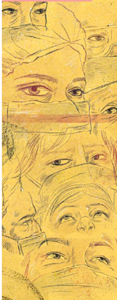
ILUSTRACIÓN ANICORTE. EL UNIVERSAL