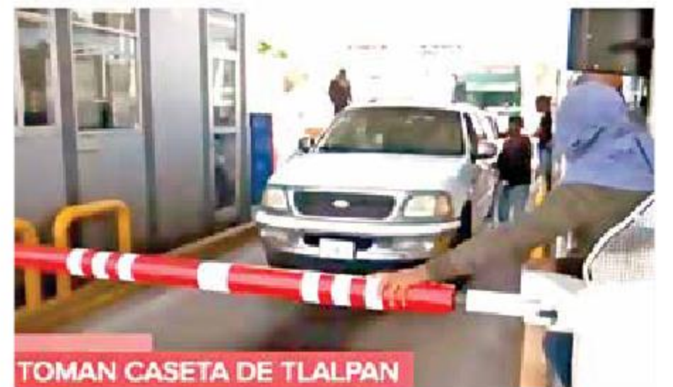
TOMAN CASETA DE TLALPAN