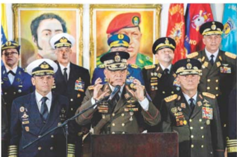
El ministro de Defensa Vladimir Padrino, y la cúpula militar respaldaron a Maduro, al decir que no aceptarán a un presidente proclamado.

“El gobierno de México y el gobierno de Uruguay han propuesto que se cree una iniciativa internacional para promover un diálogo de las partes en