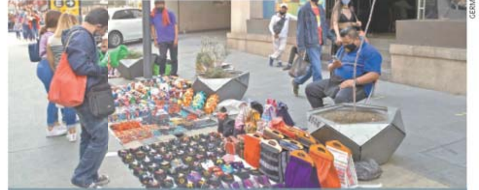
Están en el olvido, pese a los millones de familias que concentra este sector. En medio de la crisis por Covid-19 los apoyos han sido mínimos. | A34 |