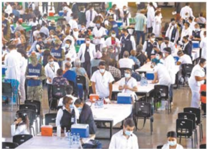
En el arranque de la vacunación en la alcaldía Coyoacán cientos de adultos mayores fueron a recibir la primera dosis. | A22 |

2,208,755 CASOS CONFIRMADOS 199,627 MUERTOS