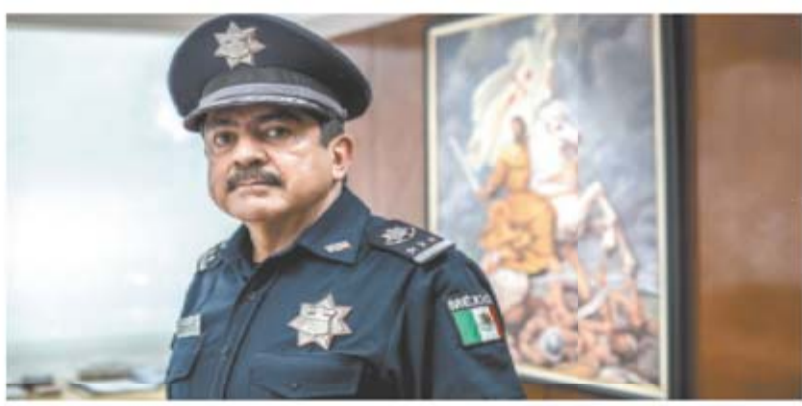
Germán Espinosa, El Universal