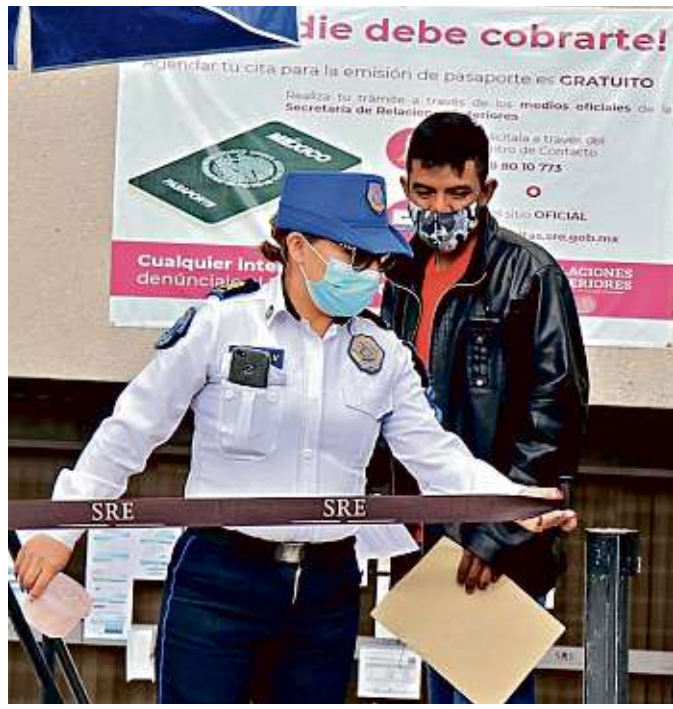
Ante la falta de citas, usuarios acudieron infructuosamente a la sede de Cancillería, donde les pidieron esperar.

Para el arranque de operaciones se estima que la empresa tendrá mil 200 colaboradores.