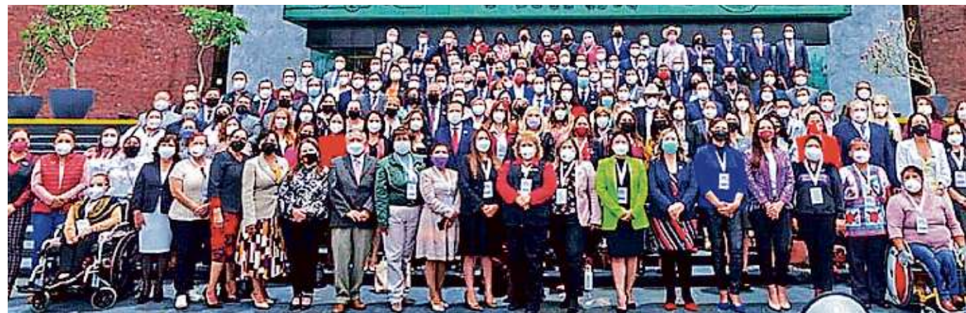
Morena inició ayer su plenaria y advirtió que va por el control de la Cámara de Diputados.

Las demandas son por daños materiales, como pérdida de ingresos y gastos médicos, y daños morales. Abogados de la firma aseguran que los familiares de las víctimas fallecidas podrían cobrar hasta un millón de dólares.