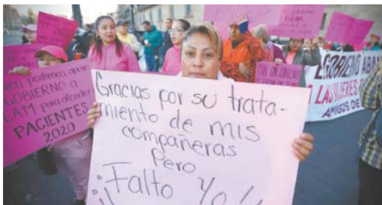
BERENICE FRECOSO, EL UNIVERSAL

● Piden pena de muerte para violadores y feminicidas. A7