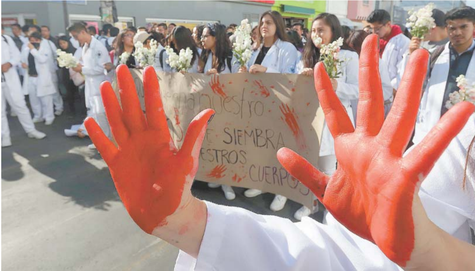
OMAR CONTRERAS, EL UNIVERSAL

Puebla. — Al grito de “¡Justicia!” y “¡Ni una bata menos!”, miles de estudiantes de medicina de la Benemérita Universidad Autónoma de Puebla y otras instituciones, junto con conductores de Uber, se manifestaron para protestar contra el asesinato de tres estudiantes y un chofer ocurrido el fin de semana. El gobernador prometió reforzar la seguridad y justicia. ESTADOS A24