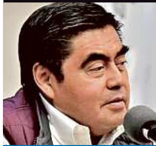
Miguel Barbosa, Gobernador de Puebla

Quiénes están contagiados ahorita, seguramente hay mucha gente, algunos son padres de familia, sí, la mayoría son gente acomodada, eh. Si ustedes son ricos, tienen el riesgo, si ustedes son pobres, no, los pobres estamos inmunes, sale".