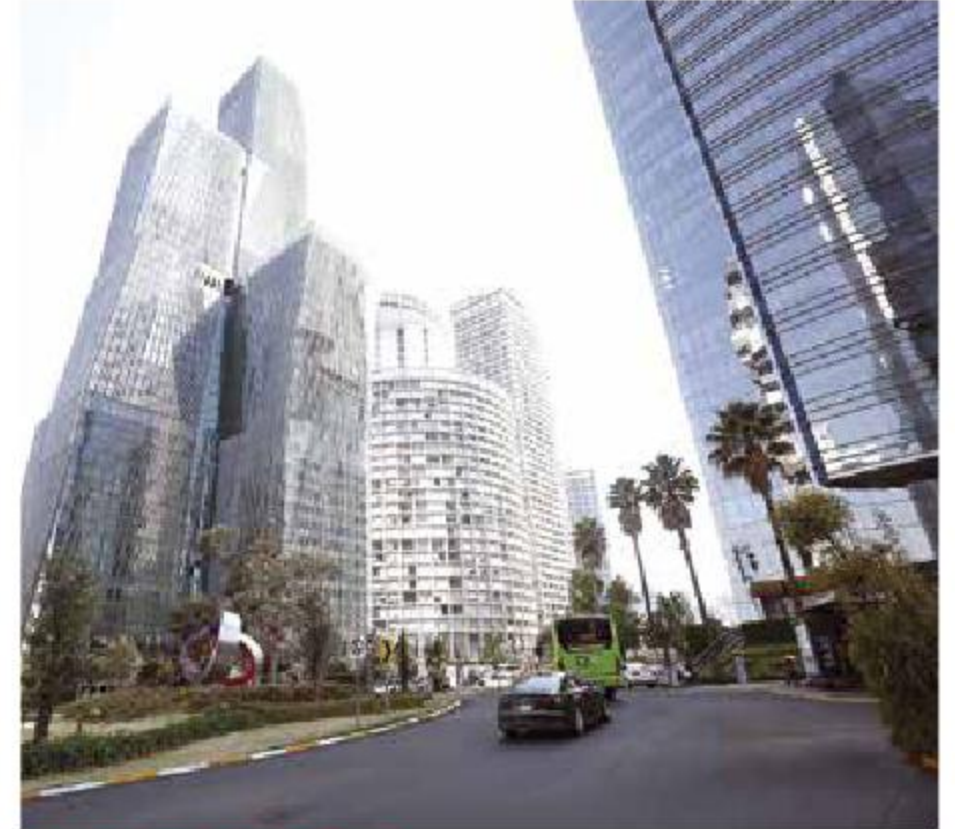
SANTA FE, SOLITARIA