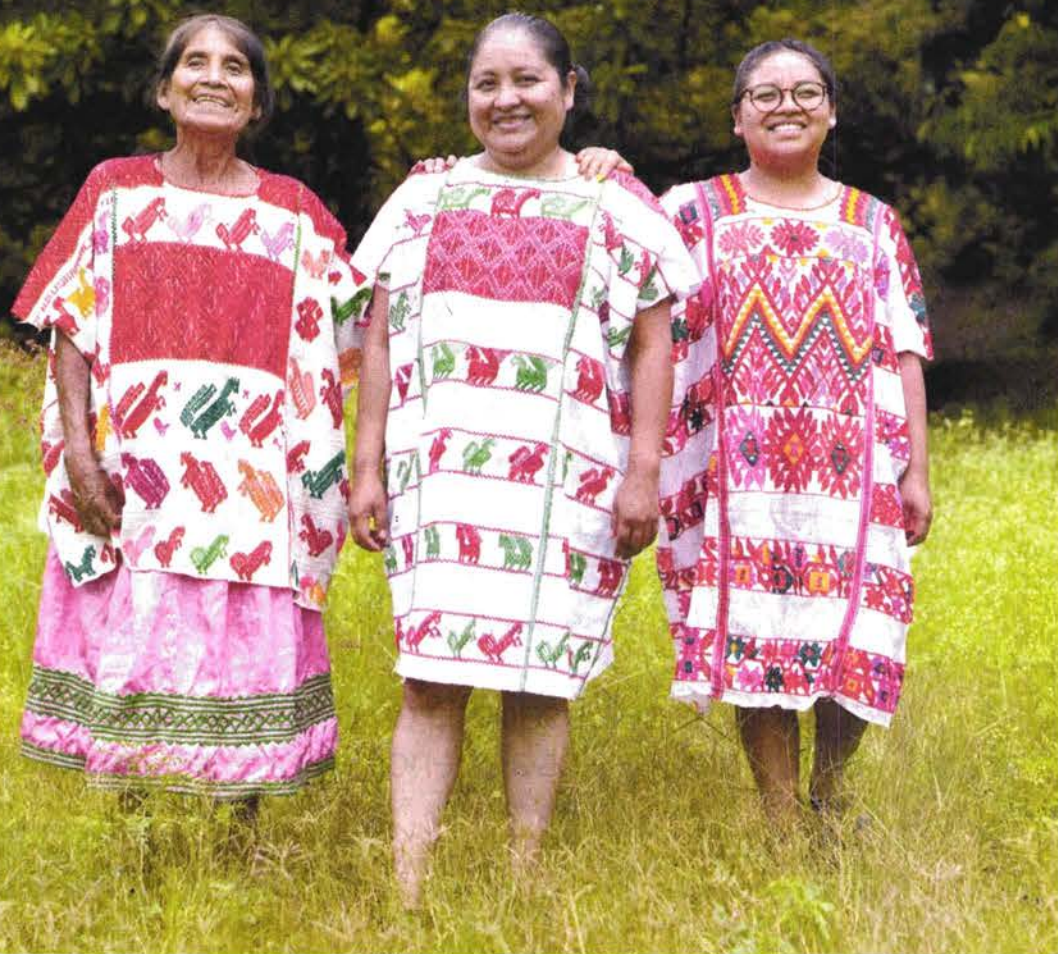
SALVADOR CESEROS/EL UNIVERSAL