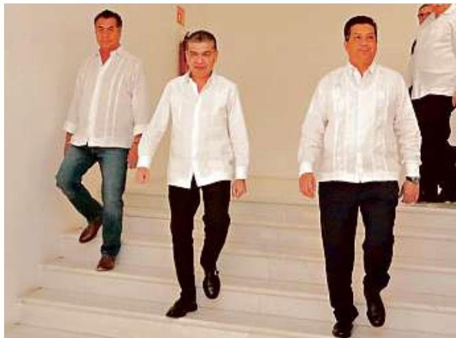
Los Gobernadores de Nuevo León, Jaime Rodríguez; Coahuila, Miguel Á. Riquelme, y Tamaulipas, Francisco García, tuvieron su segunda reunión para hacer frente al Covid-19.

servicios, a nivel nacional o internacional, como equipo médico, agentes de diagnóstico, material quirúrgico y de curación y productos higiénicos. También todo tipo de mercancías y objetos que resulten necesarios para hacer frente a la contingencia. De igual forma, la Secretaría de Salud estará facultada para importar y autorizar la importación, así como la adquisición en el territorio nacional de los bienes y servicios que requiera, sin necesidad de agotar trámite administrativo alguno, por las cantidades o conceptos necesarios para afrontar la contingencia. Todo lo anterior deberá realizarse evitando la especulación de precios y el acopio de bienes esenciales.