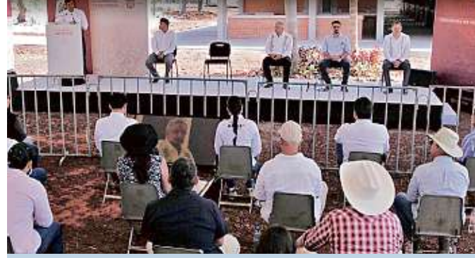
El Presidente emprendió una gira de fin de semana que lo llevará a Nayarit (foto), Baja California y Sinaloa.