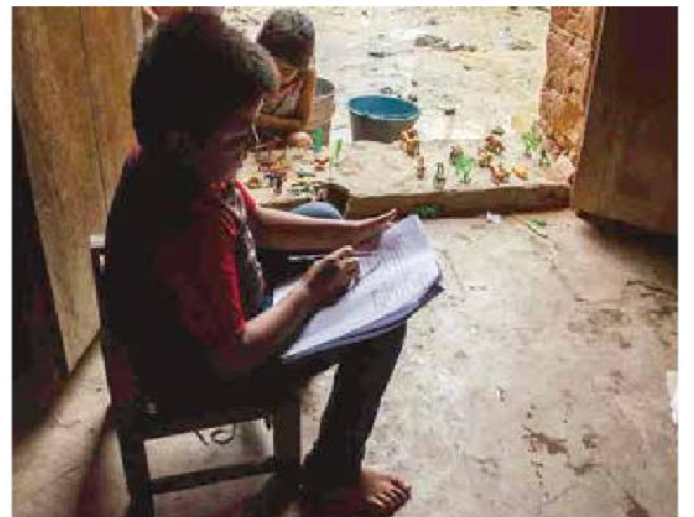
Los niños que mantienen sus actividades escolares lo hacen a través de material impreso. En la Montaña, la energía eléctrica es un lujo.

“Ha sido una pesadilla para ellos porque nacen con hambre, desnutridos, con los pies desnudos y no hay posibilidades de que se den el lujo de sentarse a estudiar frente a una laptop o