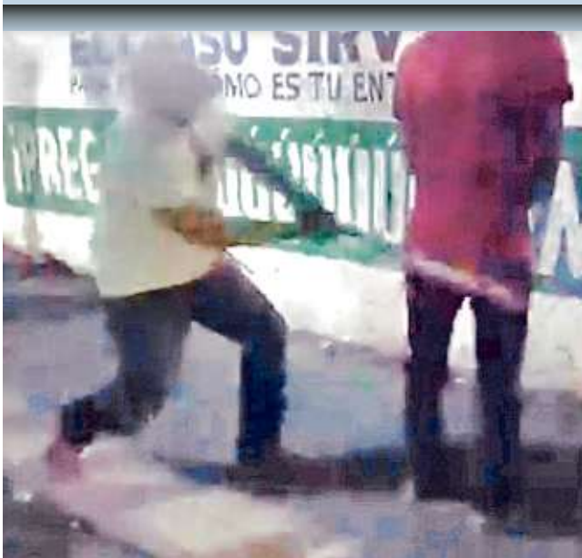
En Teloloapan, Guerrero, jóvenes recibieron tablazos por no quedarse en su casa.

La secretaria es la primera integrante del Gabinete federal legal que da positivo de Covid-19.