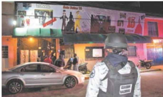
Una fiesta de XV años fue suspendida en Ecatepec.