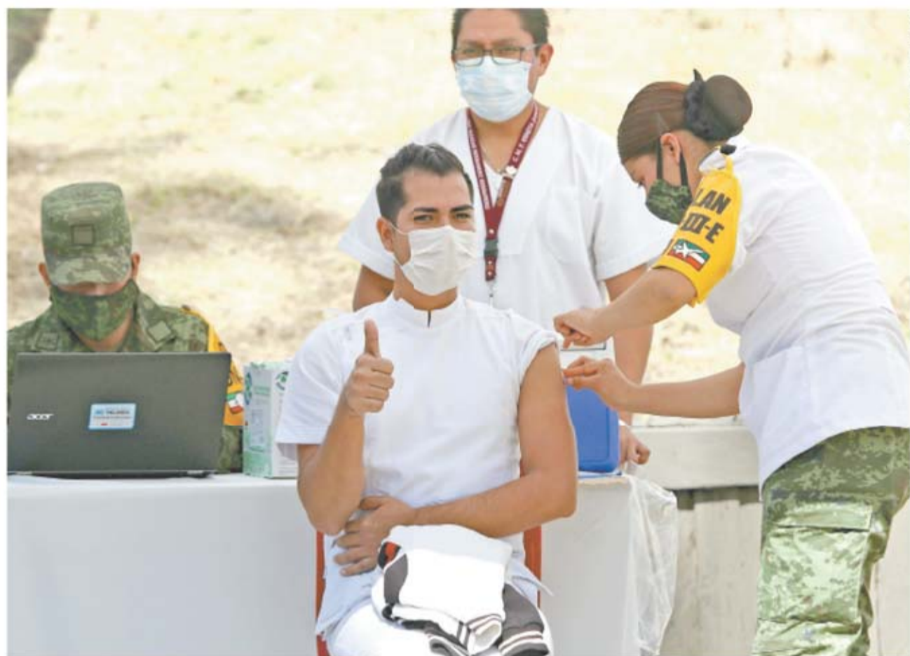
Autoridades del sector Salud reiniciaron la aplicación de vacunas contra el Covid-19 al personal médico, civil y militar que atiende esta enfermedad en hospitales de la Ciudad de México. En total, ayer se aplicaron 3 mil 900 dosis.