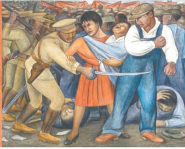
© BANCO DE MÉXICO FIDUCIARIO MUSEO DIEGO RIVERA Y FRIDA KAHLO

LA EXHIBICIÓN EN EL MUSEO WHITNEY SE CENTRA EN LA INFLUENCIA DE DROZCO, RIVERA Y SIQUEIROS EN LOS ESTADOUNIDENSES. A31