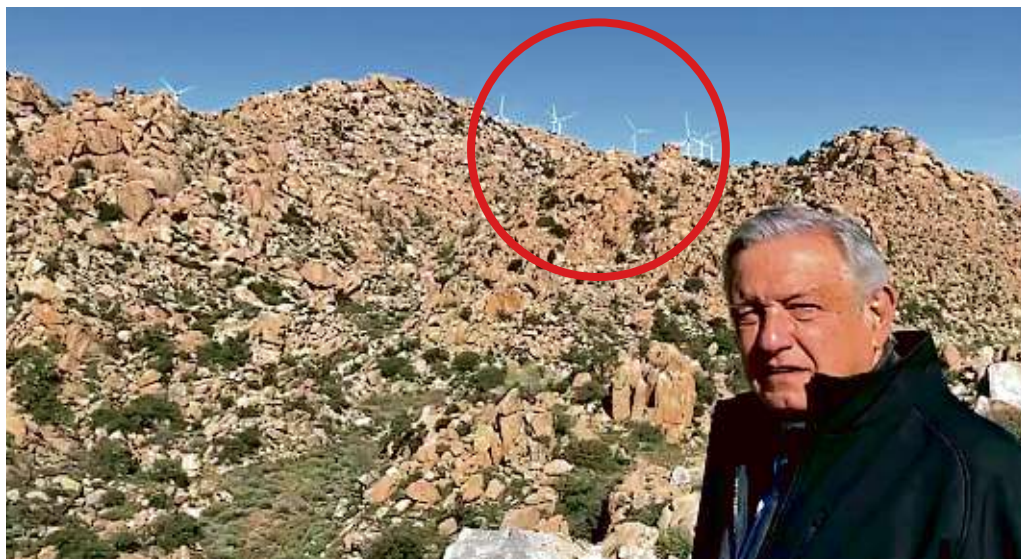
El Presidente se detuvo en el parque eólico para criticar la inversión privada en el sector.

Especialistas del sector energético estiman que hay más de 50 proyectos de generación eléctrica con tecnologías limpias o renovables frenados en el País. Dichos planes representan inversiones por más de 10 mil millones