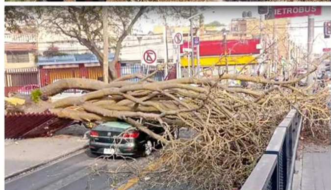
Rachas de vientos de hasta 60 kilómetros/hora en el Valle de México propiciaron caída de árboles y avance de incendios.