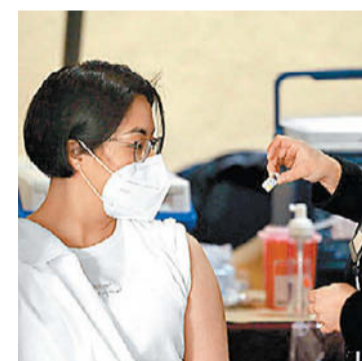
Continúa la inmunización.