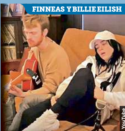
FINNEAS Y BILLIE EILISH

Sin escenario, pero conectadas a través de internet, estrellas musicales emocionaron a millones de seguidores durante el iHeart Living Room Concert para América. GENTE