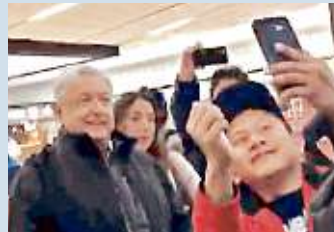
AMLO la noche del sábado al volar de Tijuana a Culiacán.

"Hoy ese incidente, ese montaje, porque inclusive llegué aquí en la noche a Culiacán y a la salida del avión me vuelven a tomar la temperatura y lo hago, porque todos debemos hacerlo, y afortunadamente 36 grados, o sea que estoy bien. Pero hoy veo las redes sociales y dicen que me negué a que me tomaran la temperatura, están muy molestos porque no aceptan la transformación", consideró.