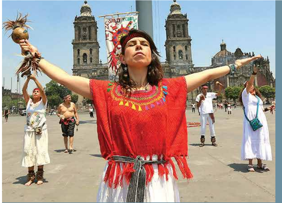
Ilustración: Abraham Cruz

PIDEN FIN DE PANDEMIA. Danzantes acudieron al Zócalo capitalino para bailar, hacer una ofrenda a la Tierra y pedir que se frene la propagación del coronavirus.