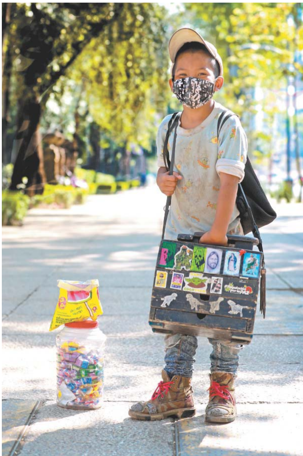
Con su cubrebocas, a este pequeño de 8 años le tocó pasar la contingencia sanitaria en las calles, trabajando.