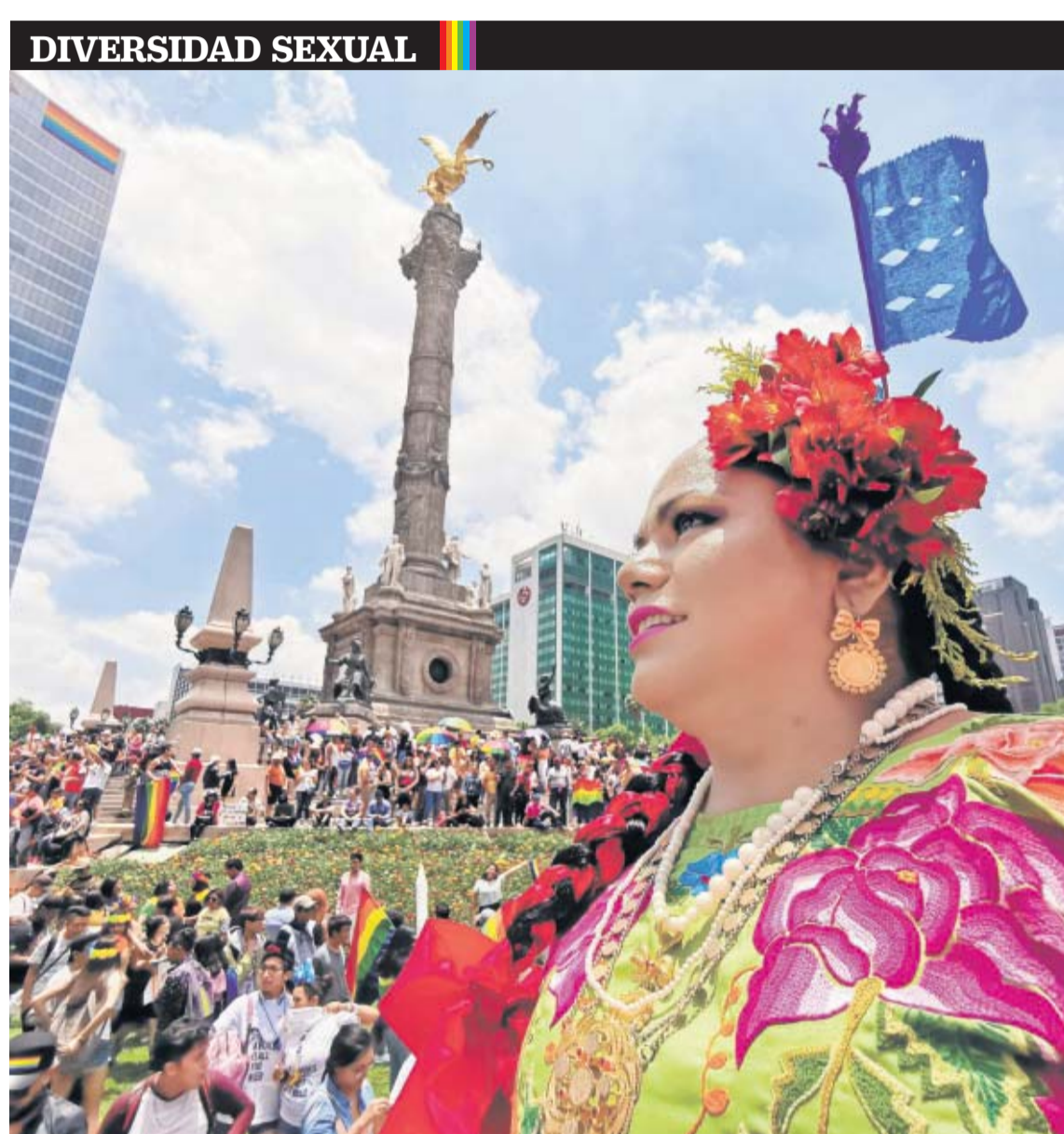
La comunidad muxe viajó 720 kilómetros desde Juchitán, Oaxaca, para participar en la 41 Marcha del Orgullo LGBTTTI en la Ciudad de México. Desde hace 10 años, el contingente indígena no acudía a la celebración.

Entre 450 y 600 policías militares, navales y federales patrullarán cada zona, dependiendo de los índices delictivos reportados.