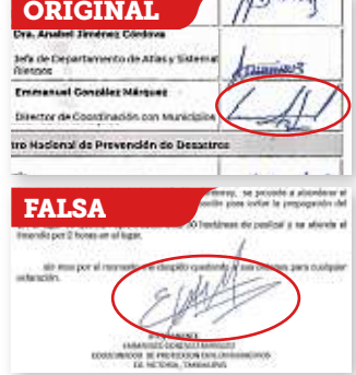
La firma fue desconocida por Protección Civil estatal.