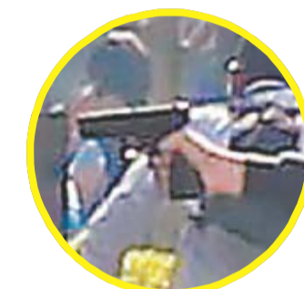
El arma perteneció a un policía, quien frustró un robo 2 años atrás.

“Ha cambiado profundamente el perfil de los mexicanos que emigran a EU. Ahora uno de cada seis tiene estudios universitarios terminados”. OPINIÓN A17