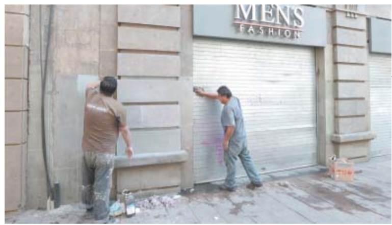
Trabajadores borran las pintas que hicieron anarquistas el lunes pasado.

México tiene 4.55 puntos en una escala de 10, debajo de las 4.65 unidades del año anterior. De 14 disciplinas evaluadas, en nueve está abajo de la media latinoamericana, dice el informe. MUNDO A17