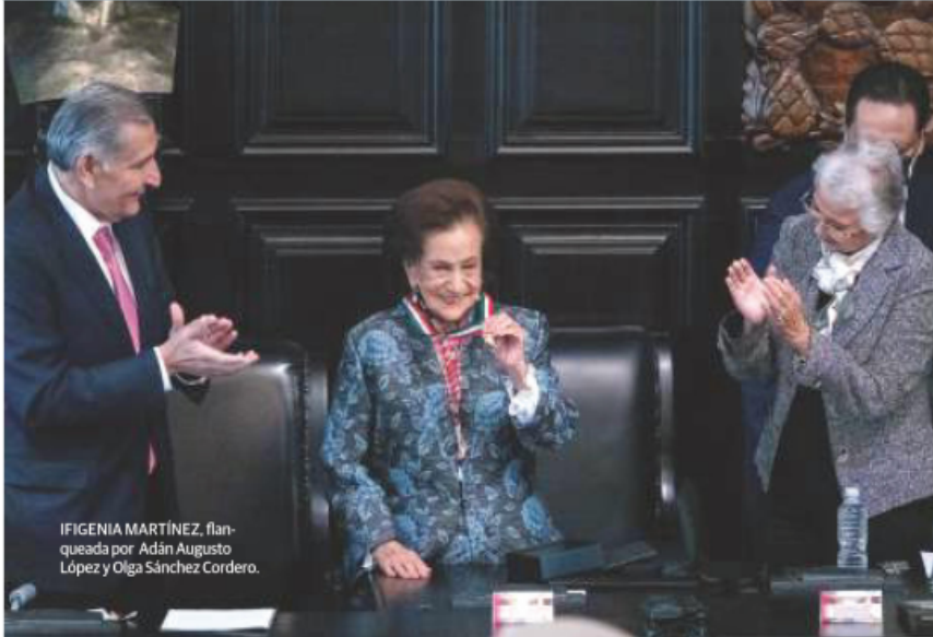
IFIGENIA MARTÍNEZ, flanqueada por Adán Augusto López y Olga Sánchez Cordero.