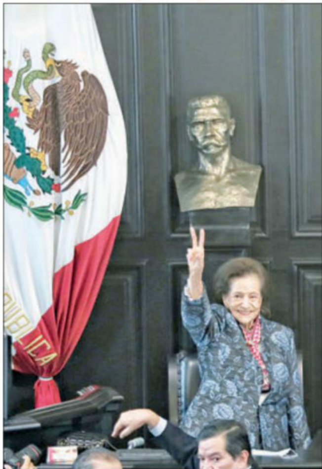
▲ La maestra, en sesión solemne del Senado