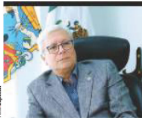
JAIME Bonilla, en entrevista con La Razón.

Gobernador de BC señala que hay diputados, alcaldes y gobernadores que no tienen pensamiento del movimiento; en su gestión, le sorprendió el sur profundo de su estado, confiesa pág. 8