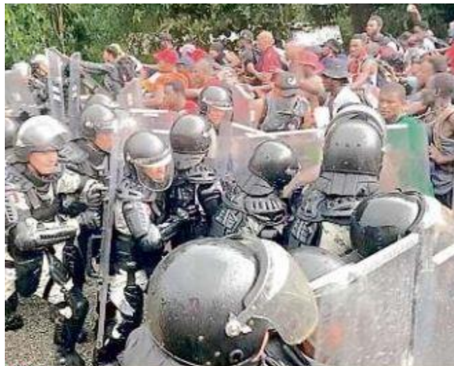
■ Miles de haitianos han ingresado a México de forma irregular, mientras autoridades usan la fuerza para frenarlos.