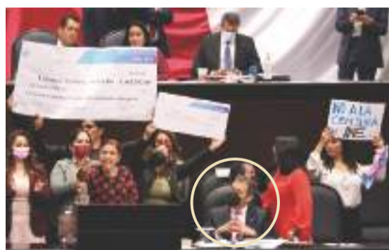
LORENZO CÓRDOVA, círculo, ayer.

◦ Presidente del INE responde con serenidad a reclamos y ofensas de grupos mayoritarios; propugna autonomía y llama a la defensa de la democracia