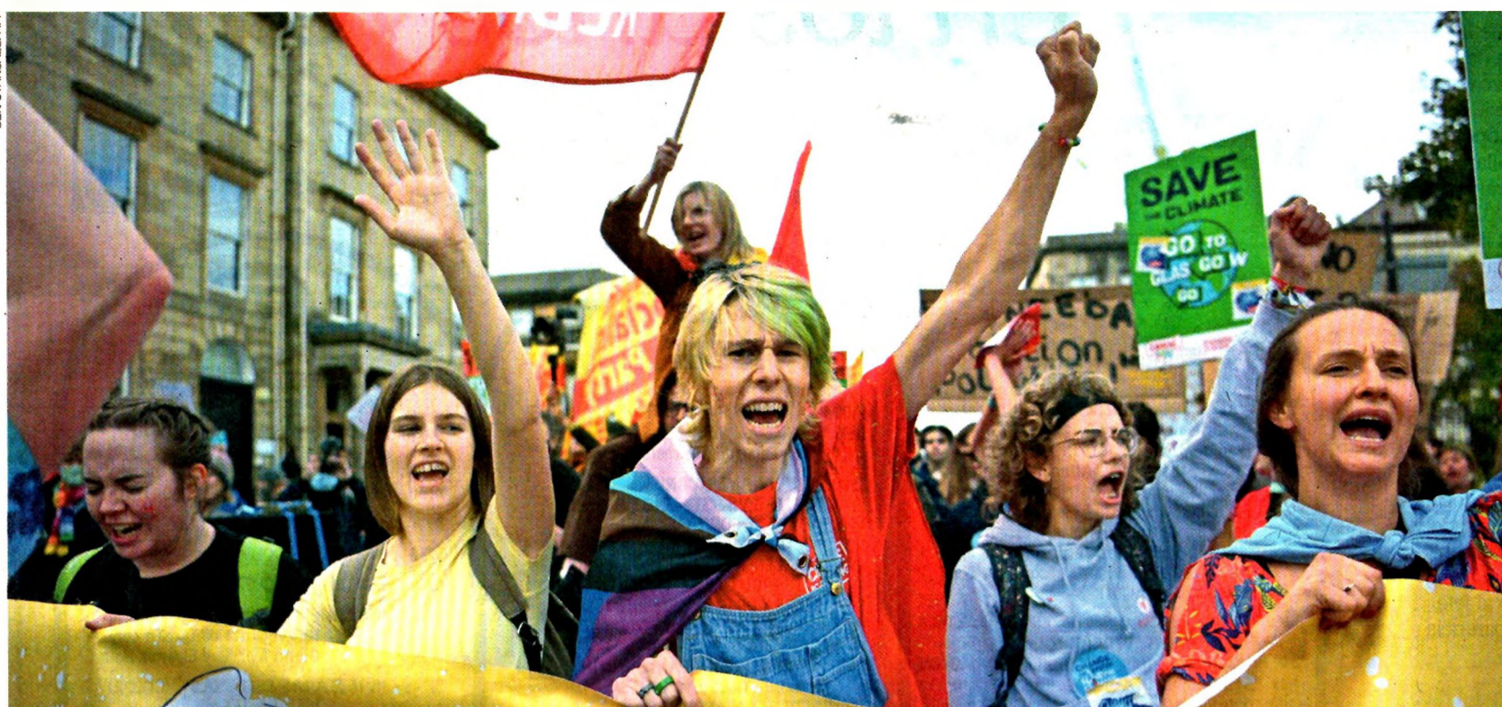
Glasgow. — Al menos 25 mil jóvenes se manifestaron ayer contra el calentamiento global, al margen de la COP26, a la que calificaron como un "fracaso", mientras expertos alertan que la crisis de energéticos en Europa afecta la batalla contra la descarbonización. | A16 |