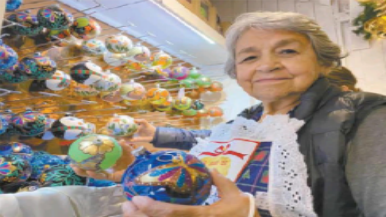
CARLOS MIER/EL UNIVERSAL