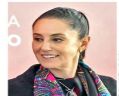
Claudia Sheinbaum, ayer en un evento en Iztaacalco

Sheinbaum señaló que la tenencia en el Edomex tiene un menor costo, mientras en Morelos el trámite se realiza principalmente por dueños de autos de lujo, porque