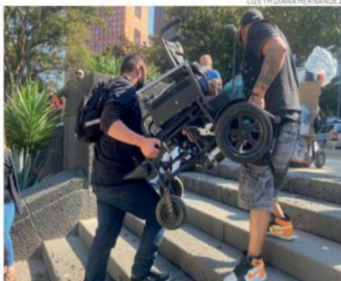
La silla de un adolescente que debió bajar en brazos de su padre.

“La directora de Conacyt —Elena Álvarez-Buylla— no es una interlocutora confiable porque violó la normativa”, fue la denuncia unánime. PAG 14