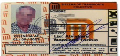
Defraudadores ofrecen también tarjetas de acceso gratuito.