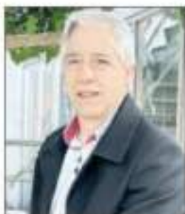
▲ El ex vicepresidente de Bolivia durante la entrevista.