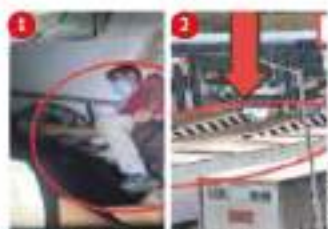
Pederos cubren veredades en los casos de tráfico (1). El sindicato tenía 4 meses en barco para prevenir (2). El puerto afectó a los migrantes de Chiapas

MÉXICO y 6 países más van tras culpables de tragedia migrante en Chiapas; cada uno indagará en su territorio