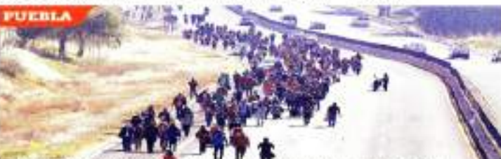
La caravana de migrantes recorrió ayer 24 kilómetros rumbo a la Ciudad de México.

Los heridos no fueron atendidos hasta 40 minutos después. El grupo continuó hoy en la mañana su camino a la capital.