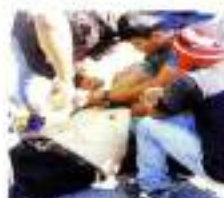
Los migrantes fueron atropellados 40 minutos después de ser atropellados.

Desorientados, los agentes aperturaron la velocidad de la camioneta y en su paso