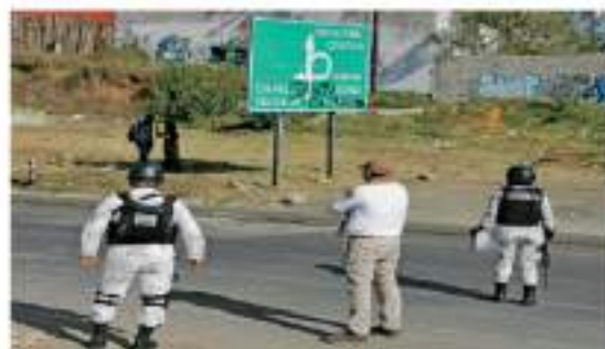
Este día se observó una gran cantidad de retención en la frontera con Guatemala y el punto donde volcó el tráiler que llevaba a los migrantes.