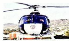
■ Uno de los helicópteros que usa la Policía de Morelos.

de diciembre de 2018 a abril de 2021 el gasto de la Administración de Cuauhtémoc Blanco (PES-Morena-PT) para el mantenimiento de esos aparatos sumó 1971 millones de pesos. Se trata de 31 pagos a las empresas Val Aeroespacial S.A. de C.V. y Action Servicios Aeronáuticos S.A. de C.V. Empero, bitácoras de vuelo de 2019 muestran pocos días de vuelo, detectó el Centro de Investigación de Morelos Rinde Cuentas. En total, ambas unidades volaron 211 horas en 83 días, que equivale hasta 722 mil pesos al día por operación, indicó. Para 2020, la CES reservó la información de las bitácoras de forma parcial y para 2021 no fue entregada.