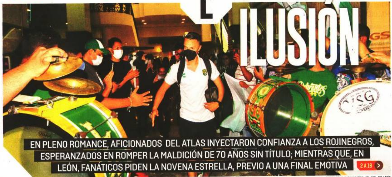
POR BRIAN SALES ENVIADOS