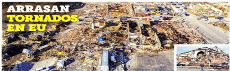
Tornados nocturnos dejaron decenas de personas fallecidas en seis estados del centro del país. Sólo en Kentucky, el Gobernador temía que la cifra superara los 100 muertos. INTERNACIONAL (PÁGINA 18)

El Tribunal Electoral de la Ciudad de México pidió al Instituto Electoral local (IECM) investigar dos denuncias en contra de la Jefa de Gobierno, Claudia Sheinbaum, por supuesta promoción personalizada con la entrega de la tarjeta "Mi Becca para Empezar". El IECM había declinado competencia a favor de la Contraloría General para realizar la indagatoria del plástico, que autoridades presentaron como "La Tarjeta de Claudia". El fallo señala que debe tomarse en cuenta si hay connotación electoral y si su finalidad es buscar promoción de aspiraciones de índole política ante la ciudadanía. REFORMA publicó el 10 de noviembre que el Gobierno movilizó a 170 funcionarios de 18 dependencias para promover y entregar la tarjeta de apoyo educativo.