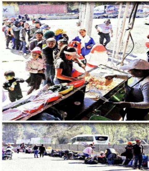
■ A su paso, los migrantes recibieron comida, ropa, zapatos y hasta dinero de pobladores y automovilistas.

dencia de Bill Clinton. En general, no es del interés de los inversionistas terminar en una disputa comercial contra México porque lleva mucho tiempo, destacó Goldwyn, actual presidente del grupo asesor de energía del Atlantic Council. "La realidad es que ningún inversionista a largo plazo en México quiere llevar al Gobierno a los tribunales o quiere instigar una disputa comercial porque demoran mucho en resolverse y los negocios sufren mientras tanto. Entonces, en términos más generales, probablemente tomarán una decisión sobre si quieren quedarse o si es hora de irse", resaltó Goldwyn. Asimismo, se ha visto deteriorado el Estado de Derecho de México, comentó Brown, actual miembro senior del Centro de Energía Global del Atlantic Council. "Permea toda la economía y sólo se va a reconstruir hasta que se encuentre una solución", dijo Brown.