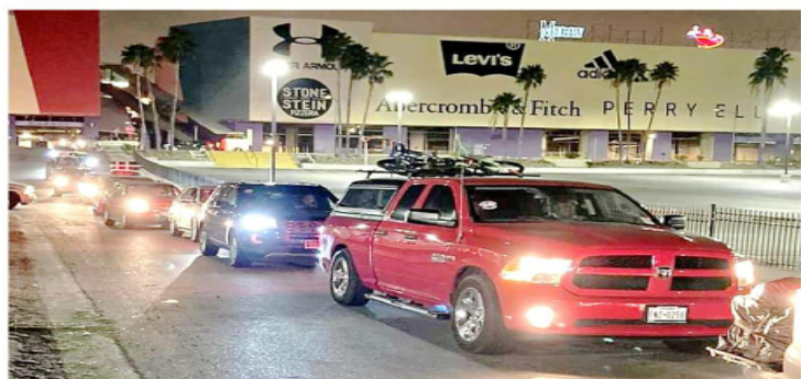
Una caravana de paisanos de casi 2 mil vehículos entró la madrugada de ayer por Nuevo Laredo.