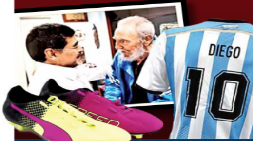
Ilustración: Horacio Sierra. Fotos: Especial

Posesiones de Maradona, como una casa, camisetas mundialistas y una foto con Fidel, salen hoy a subasta. Los precios van de 50 a 900 mil dólares. / 4