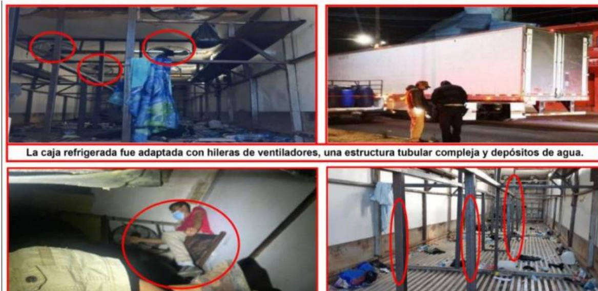
La caja refrigerada fue adaptada con hileras de ventiladores, una estructura tubular compleja y depósitos de agua.

Las cajas de los tráileres donde viajan los migrantes indocumentados por el territorio nacional han sido adaptados con hileras de ventiladores, estructuras tubulares complejas y depósitos de agua, informó Ricardo Mejía Berdeja, subsecretario de Seguridad Pública.