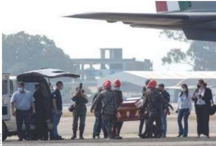
PERSONAL militar mexicano entrega los cuerpos a autoridades guatemaltecas, ayer.

El Gobierno de México repatrió ayer los cuerpos de 15 guatemaltecos que fueron identificados de manera reciente, tras la volcadura de un tráiler en Chiapa de Corzo, Chiapas, el pasado 9 de diciembre, el cual dejó 56 muertos.