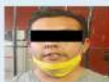
Arrestado por no usar cubrebocas