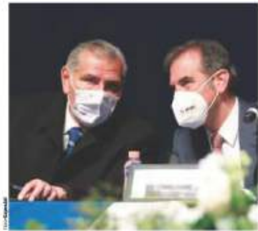
EL SECRETARIO de Gobernación, Adán Augusto López, y el presidente del INE, Lorenzo Córdova, concibieron ayer un seminario.

• Sheinbaum se enfrenta contra Córdova; parece vocero contra el INE; Sánchez Cordero llama al diálogo para llegar a consensos; PRD pide no participar en consulta