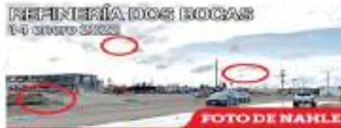
REFINERÍA DOS BOCAS 14 enero 2022

En Sokepec, fue arrestado el primero persona por no usar cubrebocas en la vía pública. Javier N., de 25 años, cursaba ocho horas de sesión luego de que fuera arrestado en vigor la reforma al artículo 104 del Código Municipal, que establece como obligatorio el uso de la mascarilla en espacios públicos para prevenir que se incrementen los contagios de Covid-19. ANÁLISIS MARIBEL