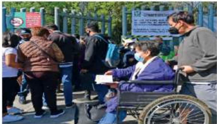
El miedo a la nueva variante de Covid-19 ahuyentó a los clientes de los restaurantes de la Ciudad de México, en tanto, en donde sí hay gente, y hacen filas, es en los hospitales. Autoridades capitalinas anuncian que se mantiene el semáforo verde y que hay mil 200 hospitalizados por este virus y, en promedio, 7 mil contagios al día. | A9 Y A10 |