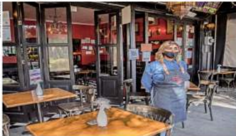
IMAGEN DEL DÍA POR ÓMICRON, RESTAURANTES VACÍOS Y HOSPITALES LLENOS

ALERTA MUNDIAL COVID-19 EN MÉXICO 4,302,069 CASOS CONFIRMADOS 301,107 MUERTOS