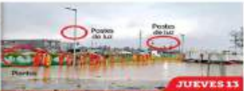
REFINERÍA DOS BOCAS 14 enero 2022

Las importaciones de carne "res, cerdo y pollo" aumentaron un punto porcentual y se convirtieron del año pasado 4 mil 377 millones de dólares, un aumento de 86.2 por ciento de acuerdo con el Grupo Consultor de Mercados Agrícolas (GCMIA). Si bien las exportaciones también crecieron, no lo hicieron en la misma proporción: 3 mil 85 millones de dólares, 24 por ciento por arriba del año anterior. Para el GCMIA, esto se explica por la elevada inflación en nivel mundial, lo cual disparó los precios del comercio exterior de carnes. En total, el déficit de balanza comercial de carne alcanzó mil 343 millones de dólares entre enero y noviembre de 2021, 294.4 por ciento mayor que en el año previo. En 2020, el déficit acumulado en el período fue de 147 millones 968 mil dólares. El precio promedio de las