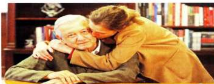
Beatriz Gutiérrez Müller, esposa del Presidente, compartió en redes esta imagen tomada ayer.

El texto está firmado por Granholm, la Secretaria de Comercio, Gina Raimondo y la Representante Comercial, Katherine Tai.