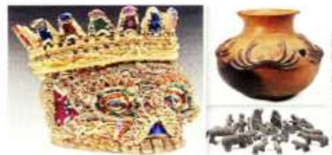
Las autoridades no han verificado el estado de la colección de arte popular, de más de 20 mil piezas, que quedó atrapada en un edificio tomado por la comunidad otomí.

"Los médicos me autorizan que puedo hacer mi vida normal, es decir que me puedo aplicar a fondo y que hay Presidente para un tiempo, el necesario, el indispensable, para llevar a cabo los cambios, la transformación", añadió.