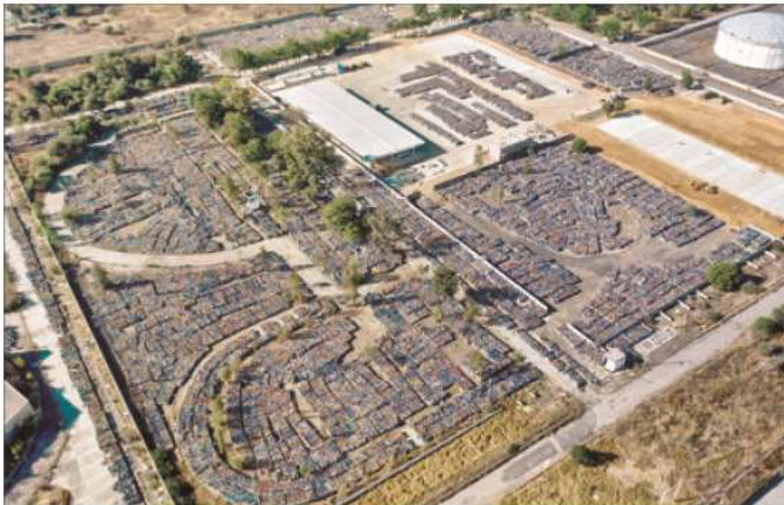
▲ Vecinos de colonias aledañas a la ex Refinería 18 de Marzo, en Azcapotzalco, pidieron “chatarrizar o reubicar” los miles de cilindros en mal estado que Gas Bienestar ha recolectado y llevado a ese lugar luego de más de dos meses de ventas. “El fuerte olor al energético

Temor de colonos por cementerio de tanques de gas