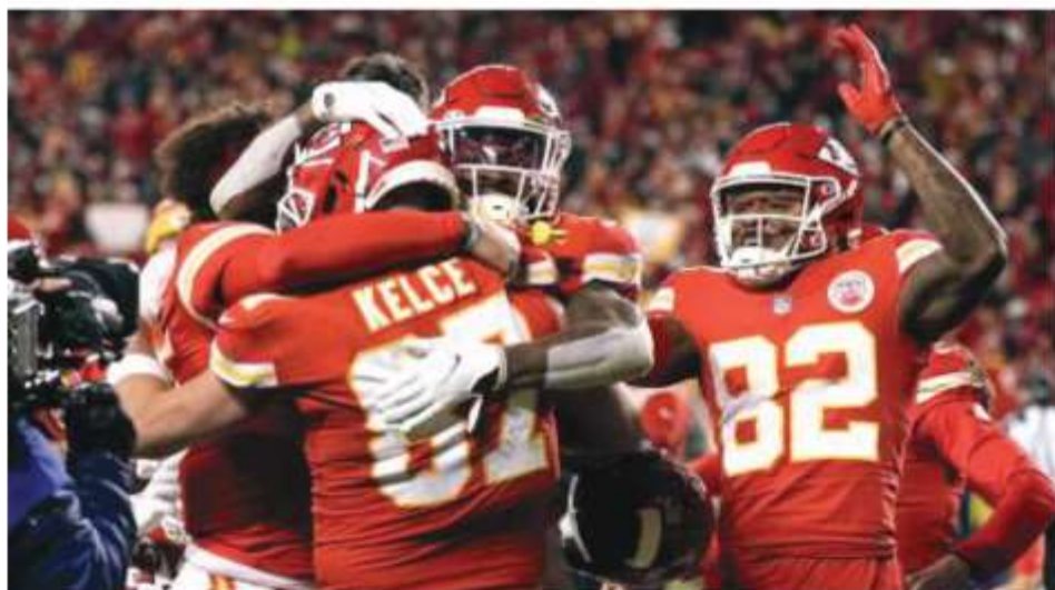
TRAVIS KELCE, de los Chiefs de Kansas, festeja tras conseguir la anotación del triunfo en tiempo extra sobre los Bills de Buffalo, ayer.