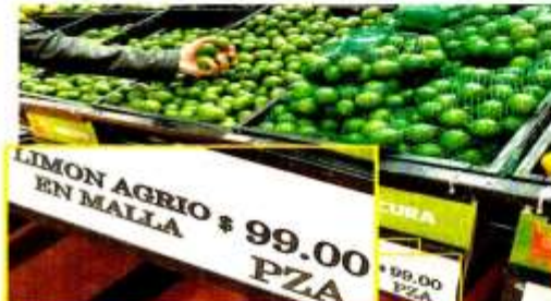
En supermercados de la Ciudad de México, el kilogramo de limón alcanza casi los 100 pesos.