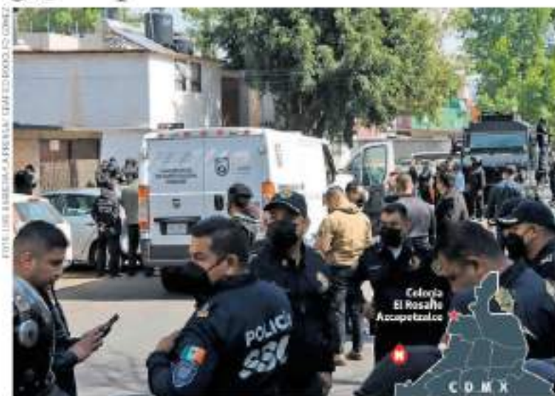
El operativo policiaco en la cerrada de Jacarandas, donde murieron cuatro personas, dos policías y dos civiles. Al parecer, en ese lugar se almacenaban drogas. Pág. 29