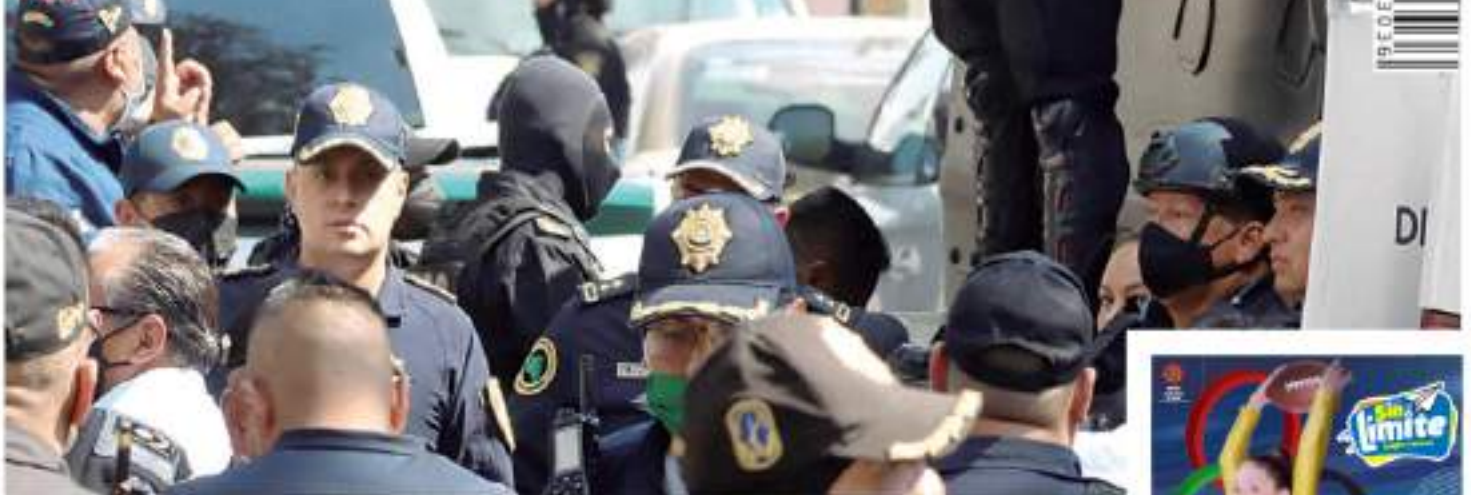
En la acción se desmanteló un centro de distribución de drogas, con 11 detenidos

COVID-19 EN MÉXICO NUEVOS CONTAGIOS 45,115 CASOS ESTIMADOS 4,873,561 | CASOS CDMX 1,207,918