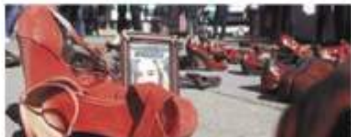
CIUDAD JUÁREZ, Chihuahua.- Dramática manifestación.

emotivo homenaje y exigieron avances en las investigaciones, muchas de las cuales llevan años perdidas. Ver página 11