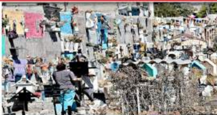
El cementerio en Chimalhuacán se vio desbordado por los muertos a causa de Covid.

"Ellos participamos y opinamos sobre los contenidos de los programas sectoriales de los gobiernos municipales, favoreciendo que las políticas educativas tuvieran un alto grado de coherencia de un sesión a otra".