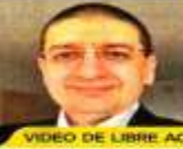
VIDEO DE LIBRE ACCESO