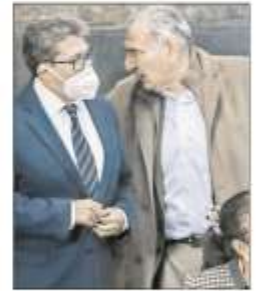
▲ Ricardo Monreal, líder de la Junta de Coordinación Política (Jucopo) del Senado, y Adán Augusto López, secretario de Gobernación, durante la plenaria de ayer en Xicoténcatl.

Ocho de cada 10 hospitalizados por covid no se vacunaron: Ssa