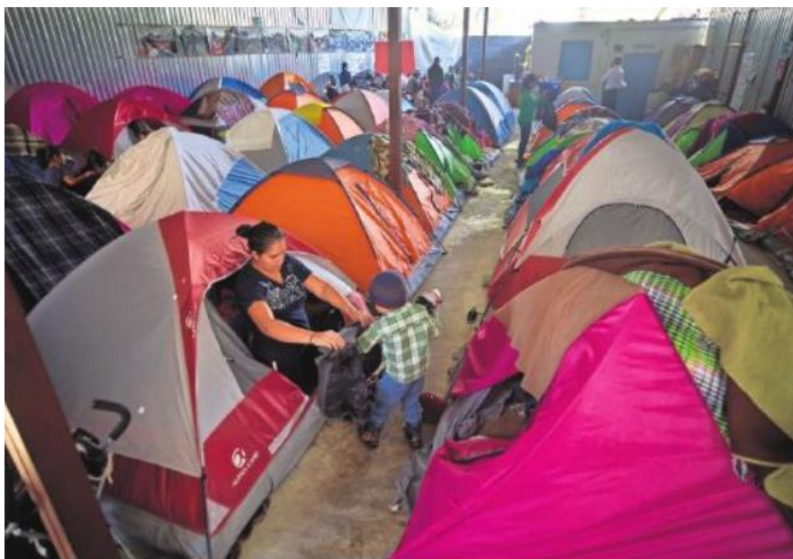
Migrantes salvadoreños en un albergue en Tijuana, en marzo de 2019.

Con el fondo musical de Todo cambia, nietos y nietas en brazos de sus abuelas conocieron a sus madres y padres que, como jóvenes guerrilleros asidos a sus fusiles, bajaron en la mañana del jueves 16 de enero de 1992 a las faldas del volcán Guazapa, en el centro de territorio salvadoreño, por un hecho histórico: la firma al mediodía en México de la paz en El Salvador.