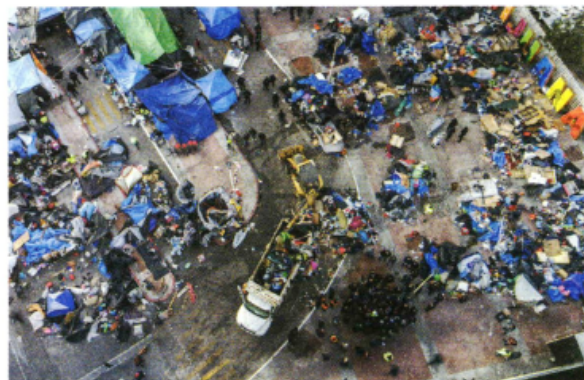
Desalojo del campamento migrante en El Chaparral, Tijuana, ayer.

EN SENTIDO contrario, la entrega de tarjetas de visitante creció 102%; ONG critican que sólo les den documentos hasta que se movilizan