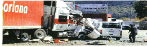
El pasado viernes, normalistas dejaron ir un tráiler contra agentes policíacos en la caseta de Palo Blanco.

...Y la Fiscalía confirma que abrió una investigación contra normalistas