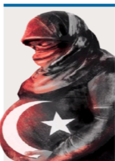
ILUSTRACIÓN: DANIEL DE LA VEGA, EL UNIVERSAL

efectos de la variable ómicron, pero también por la difícil cuesta de enero, con una inflación en niveles máximos en 21 años. | CARTERA | A21