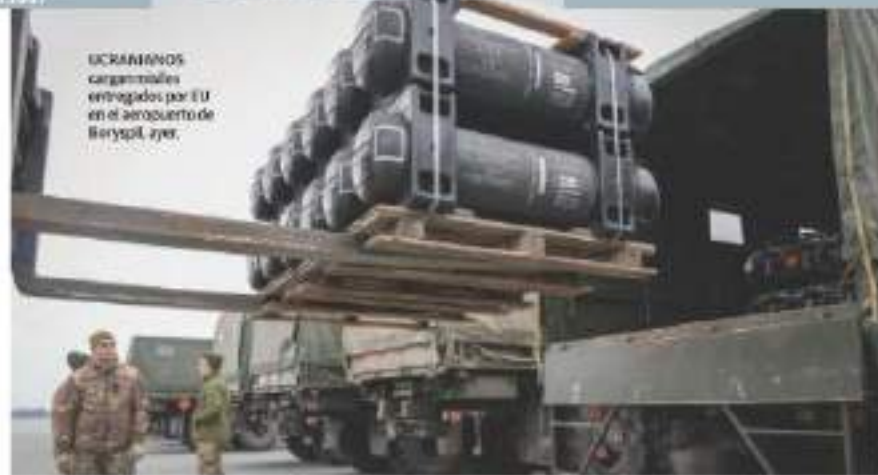
UCRANINOS cargados entregados por EU en el aeropuerto de Boryspil, ayer.

CRECE PRODUCCIÓN INDUSTRIAL 6.7%, PERO TURISMO SE RALENTIZA pág. 8