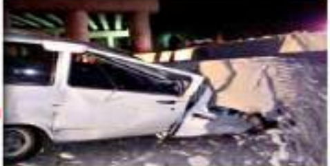
Una de las traveses cayó sobre una camioneta en el lugar donde colapsó el conductor.

ros y un potencial escenario que pudo haber cruzado la línea de lo legal y de obligaciones éticas de Baker Hughes. Por esta razón, una queja se justificó y una investigación es necesaria", afirmó Lara en su texto. "[...] Esta desafortunada serie de coincidencias ocurridas en el mismo tiempo de contratos entre Pemex y Baker Hughes fueron espasmodicos en su silencio y su costo y cuando uno de nuestros ejecutivos permitió el uso de una residencia de lujo, donde la mencionada, pareja vivió, en los días que nos pueden ignorar y tienen un deber de actuar en consecuencia. Debían considerar la urgencia para ejecutar una más exhaustiva y completa investigación en este asunto, e informar a las autoridades, inventariando y modernizando apropiadamente", subrayó. CON INFORMACIÓN DE PENÉLOPE RAMÍREZ